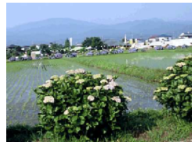
花あおい農道 あじさい農道