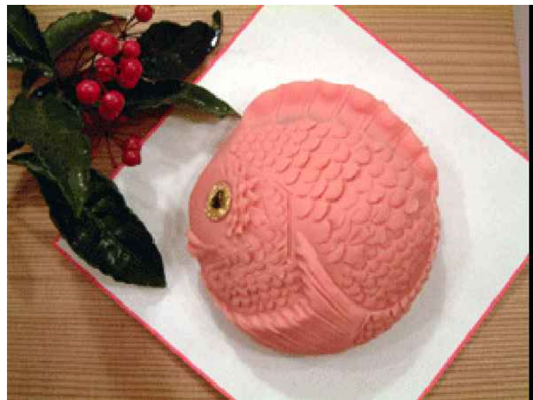
たい (生菓子) 奥津 めぐみ

「こしは、お天気つづきのあたたかいお正月を迎えました。おだやかな、あたたかい一年間になると良いと思います。昨年、院長が医師会会長に就任したことでもいろいろ忙しく患者の皆さま、スタッフに迷惑をおかけしましたが、おかげさまで、医師会の態勢も整いましたので、今年はいろいろな面で、住民の方々へのサービスができると思います。」