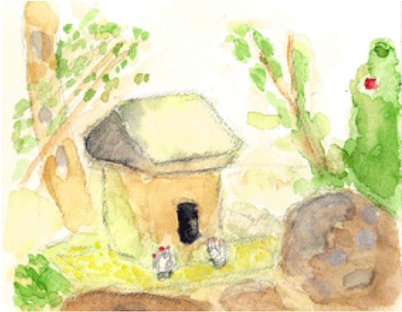
奥津医院内厄除け 稲荷様 奥津紀一 画