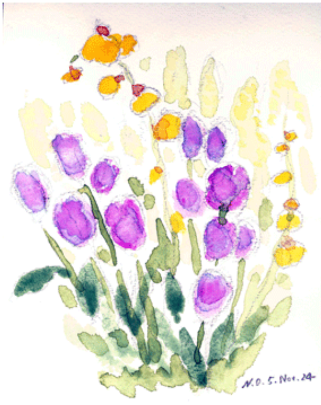
トルコキョウとオンシジウム 奥津紀一 画