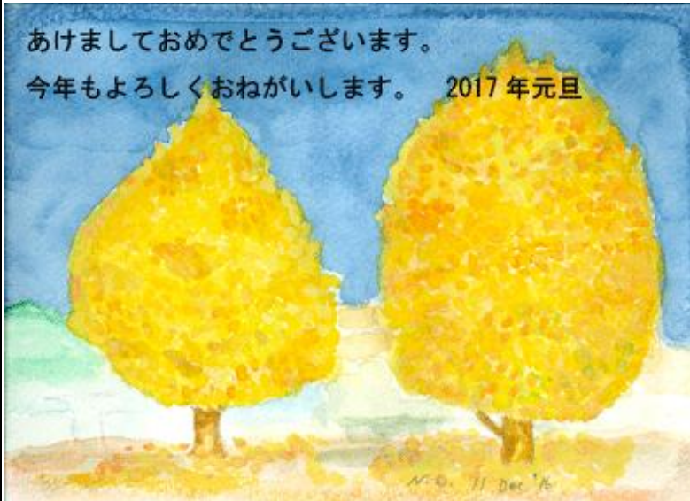
あけましておめでとうございます。 今年もよろしくおねがいします。 2017年元旦