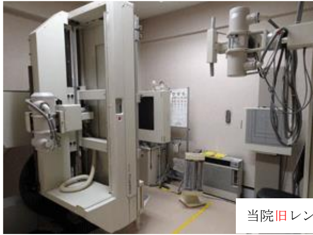
当院旧レントゲン室