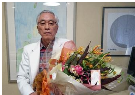
祝 院長誕生日 (1/10)