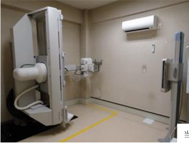
当院新レントゲン室