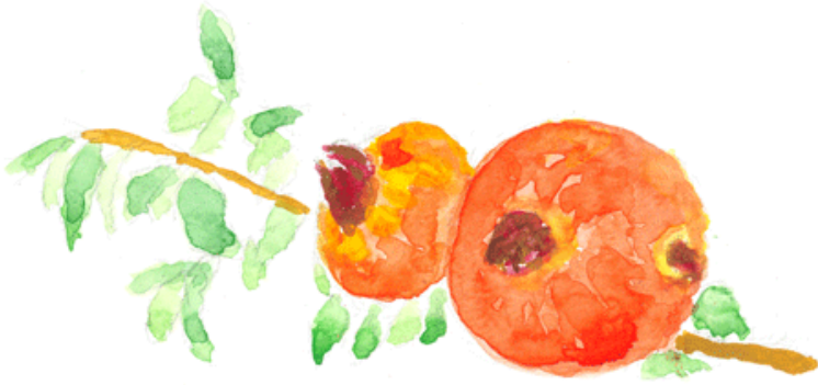
ザクロ 奥津 紀一